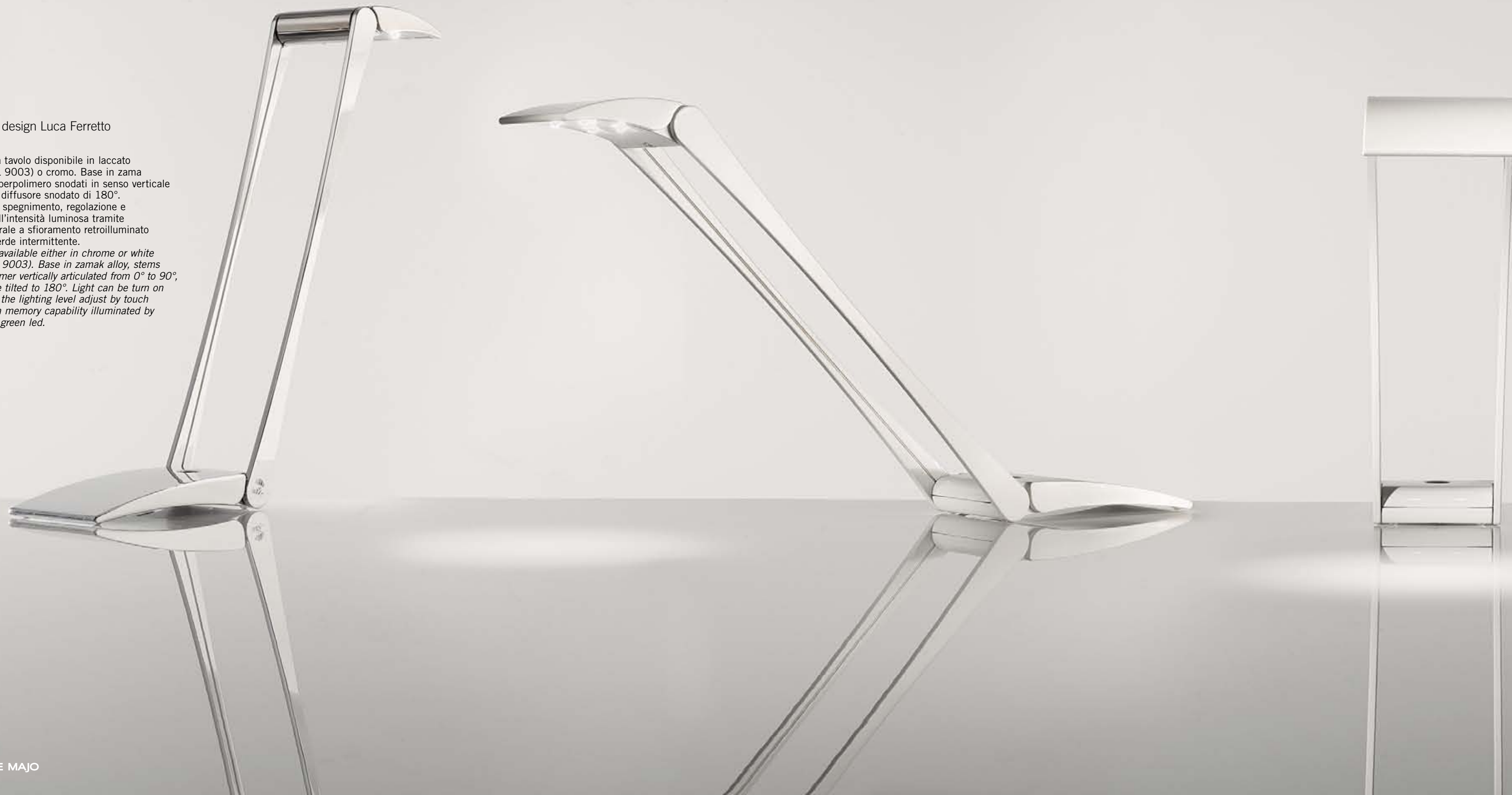
Table lamp available either in chrome or white colour (RAL 9003). Base in zamak alloy, stems in superpolymer vertically articulated from 0° to 90°, head can be tilted to 180°. Light can be turn on and off and the lighting level adjust by touch dimmer with memory capability illuminated by intermittent green led.

Lampada da tavolo disponibile in laccato bianco (RAL 9003) o cromo. Base in zama e steli in superpolimero snodati in senso verticale da 0 a 90°, diffusore snodato di 180°. Accensione, spegnimento, regolazione e memoria dell'intensità luminosa tramite il tasto centrale a sfioramento retroilluminato da un led verde intermittente.